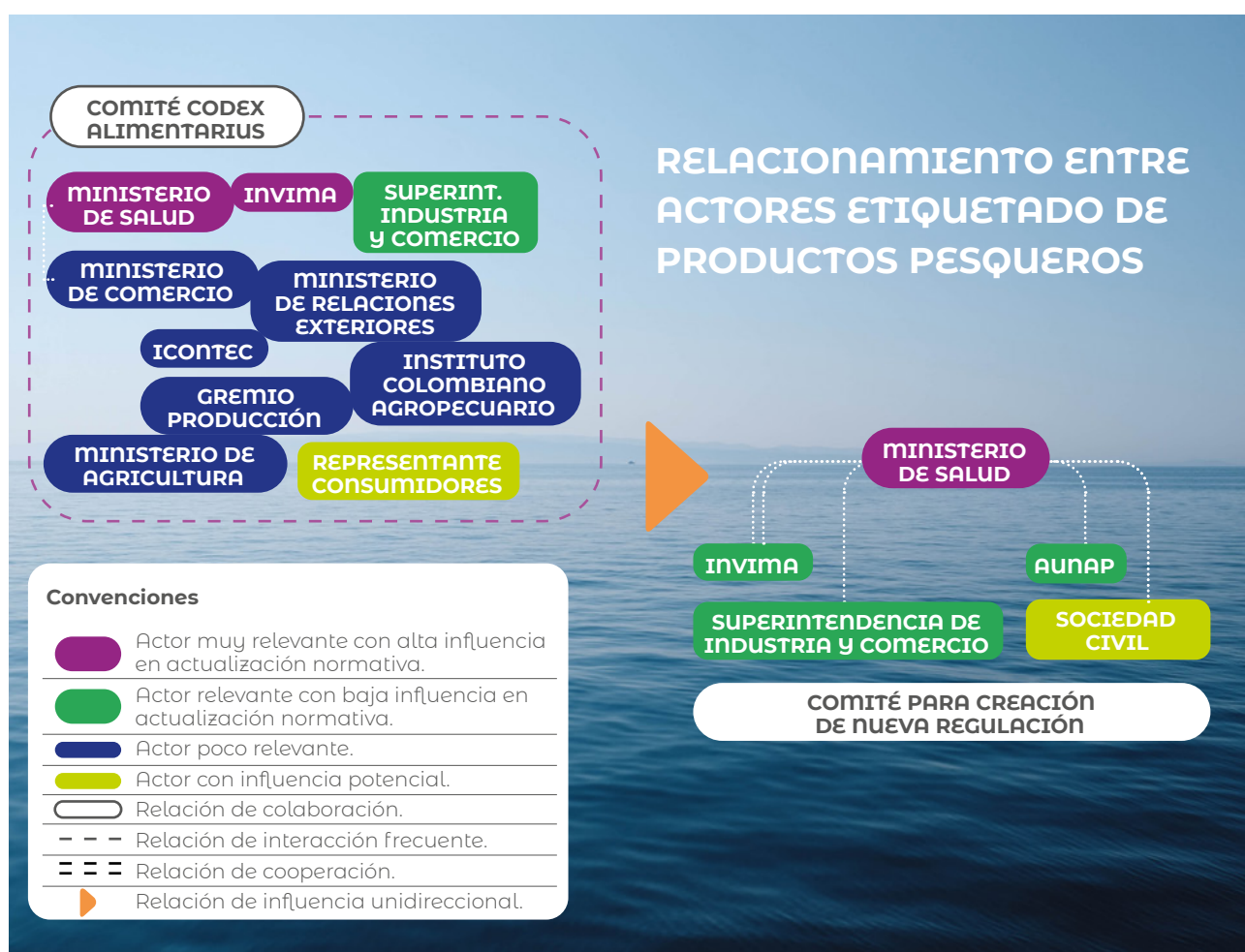
Figura 1. Relacionamiento de actores dentro del Comité Nacional del Codex Alimentarius, para el etiquetado de productos pesqueros.

Con respecto al relacionamiento entre los actores (Figura 1), estos se ven influenciados por la agenda del Comité Nacional del Codex Alimentarius, órgano técnico que asesora al Gobierno Nacional sobre buenas prácticas en normas alimentarias y representa a Colombia ante el mismo (Decreto 977, 1998; art. 1 y art. 2). En ese sentido, el Codex es una colección de directrices alimentarias, que tienen como finalidad fomentar el establecimiento de requisitos aplicables a los alimentos, para garantizar al consumidor productos seguros, genuinos, no adulterados y que estén debidamente etiquetados. La importancia de estas directrices radica en que, conforme éstas se actualizan, el Comité Nacional del Codex evalúa la posibilidad de alinear el cuadro normativo colombiano a tales cambios.