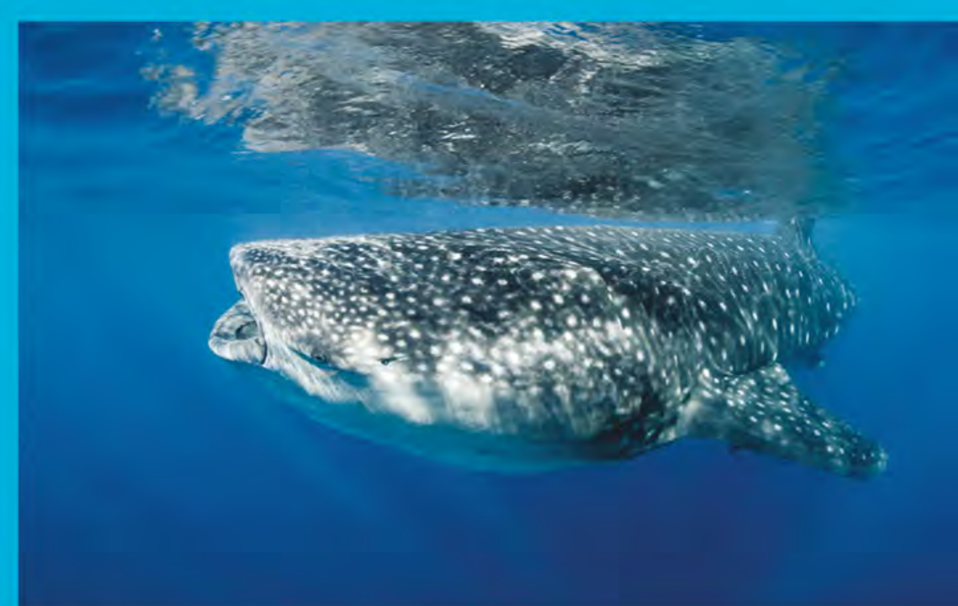
Tiburón ballena Rhincodon typus

Una investigación reveló que los participantes en la industria del avistamiento del tiburón ballena, aportaron 6 millones de dólares a la región. Además, contribuyeron entre 2.4 y 4.6 millones de dólares en gastos directos a la economía regional (Catlin y Jones 2010).