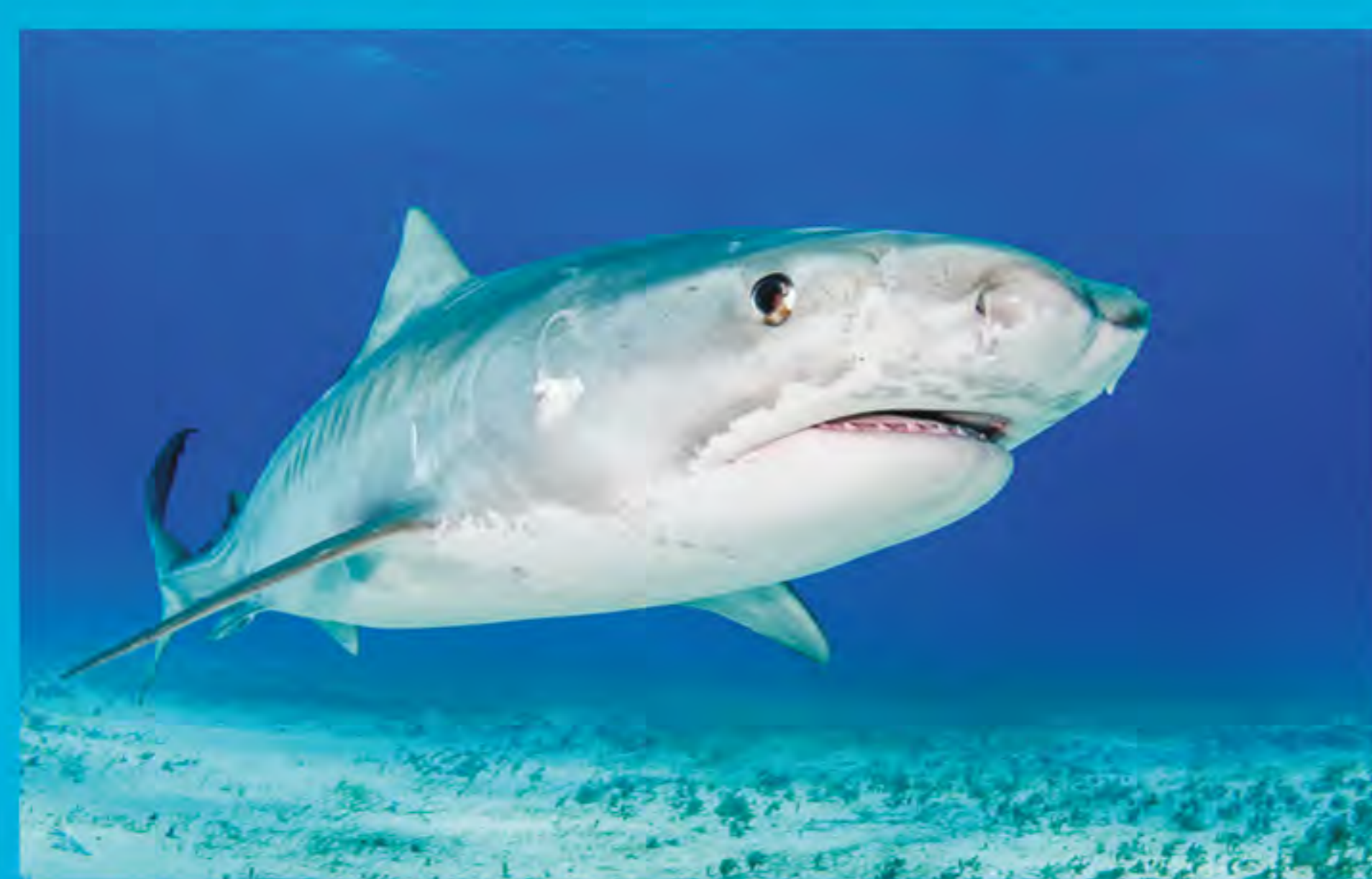
Tiburón tigre Galeocerdo cuvier

Debido a la abundancia de tiburones y compañías de avistamiento, Las Bahamas se considera la capital mundial del buceo con estos animales. En un estudio realizado en el 2017 se estimó que el buceo con tiburones genera aproximadamente 109.4 millones de dólares en ingresos anuales (Haas et al. 2017).