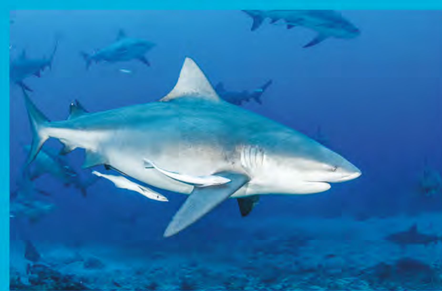
Tiburón toro Carcharhinus leucas

En un estudio reciente, se demostró que el buceo con tiburones contribuye con alrededor de 42.2 millones de dólares a la economía de Fiji. Esta suma incluye tanto los ingresos generados por la industria, como los impuestos aportados por los buzos al gobierno (Vianna et al. 2012).