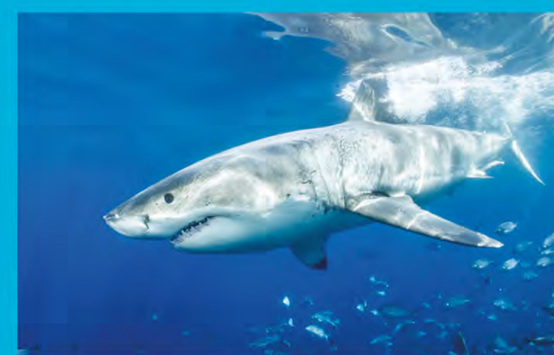
Gran tiburón blanco Carcharodon carcharias

A pesar de que en Sudáfrica habitan muchas especies de tiburones, el buceo en jaula con el gran tiburón blanco es la industria mejor conocida del país. Mediante un estudio, se estimó el valor de esta actividad por año, la cual es de 4.4 millones de dólares (Hara et al. 2003).