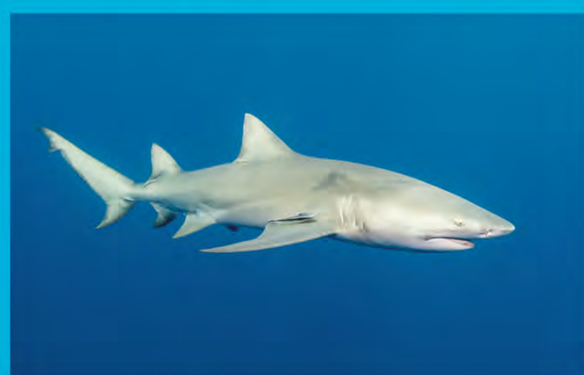
Tiburón limón Negaprion acutidens

Mediante un estudio sobre el ecoturismo en la isla Moorea, Polinesia Francesa, se lograron identificar 39 individuos de tiburón limón. En éste se calcularon los ingresos generados por el sitio de buceo, en función de los gastos de los buzos locales e internacionales (Clua et al. 2013).