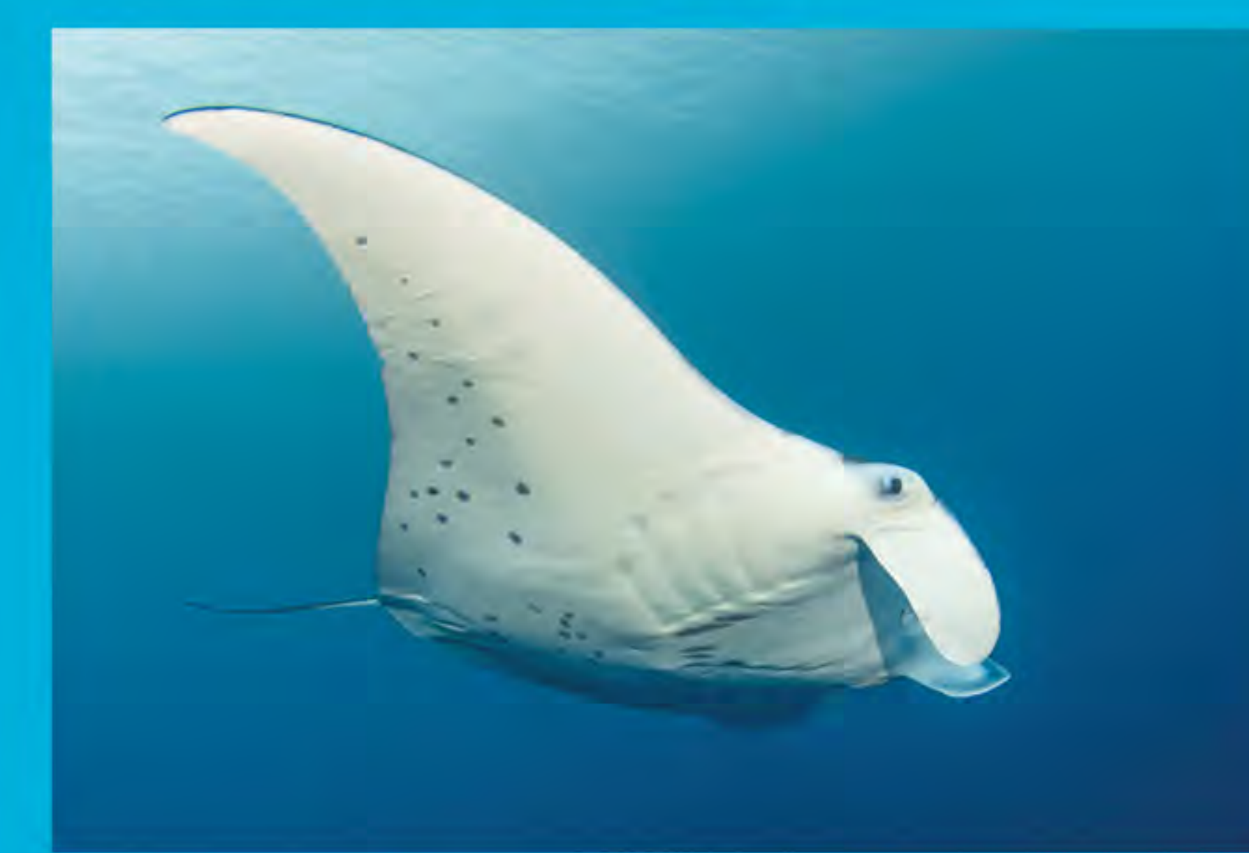
Mantarraya Manta alfredi

Mediante un estudio, que registró el número de turistas en sitios de buceo, se evaluó el alcance y el valor económico de la observación de mantarrayas en el país. Se estimó que el valor de ingresos directos es de aprox. 8.1 millones de dólares por año (Anderson et al. 2010).