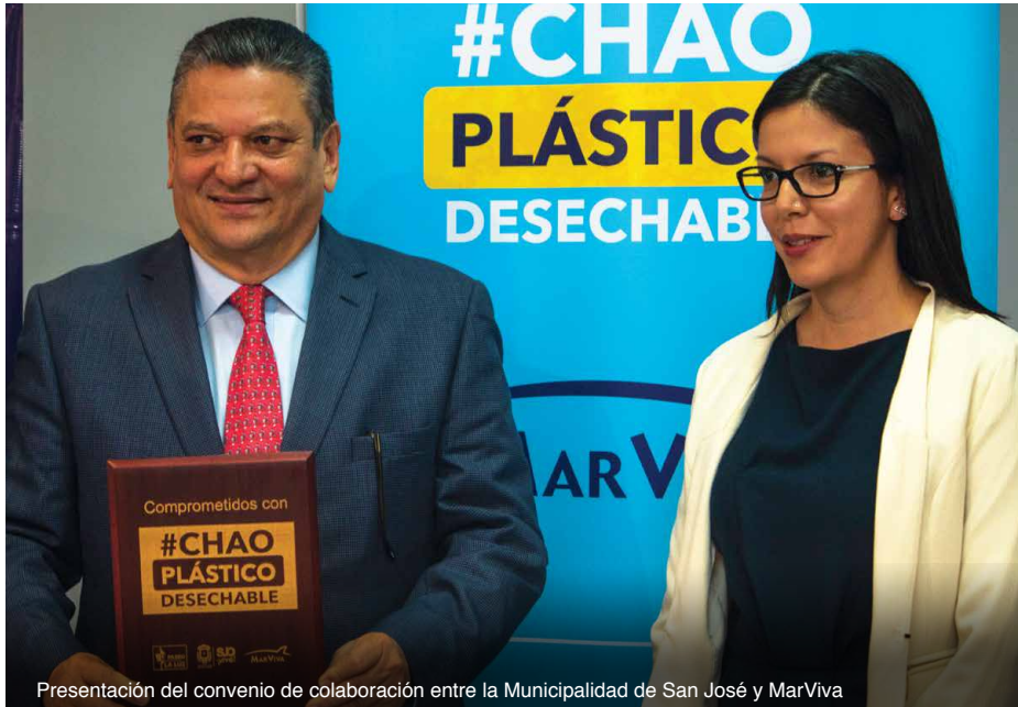
Presentación del convenio de colaboración entre la Municipalidad de San José y MarViva