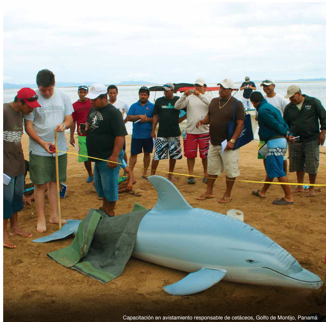
Capacitación en avistamiento responsable de cetáceos, Golfo de Montijo, Panamá