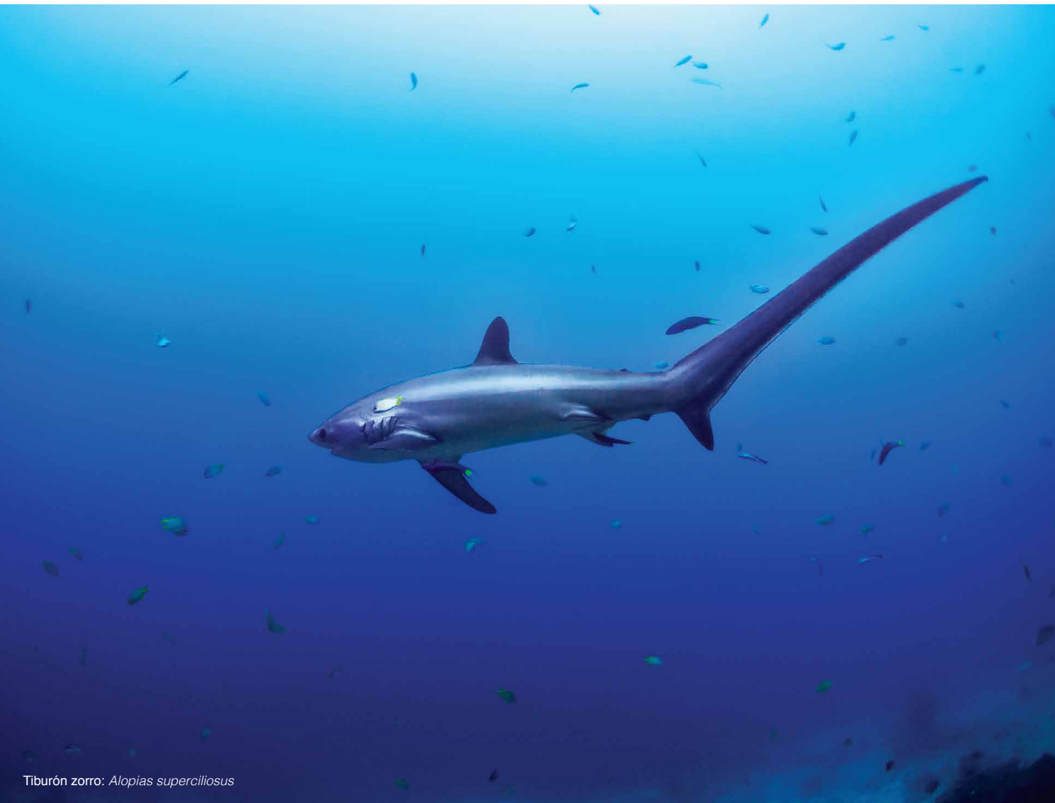
Tiburón zorro: Alopias superciliosus

El OEM es un proceso público y participativo para la planificación multisectorial y gestión integral del espacio y recursos marinos y costeros. Considera objetivos complementarios de salud y prosperidad ecológica, económica y social. Involucra a los diversos grupos de interés en la planificación, diseño e implementación de medidas para la gestión y conservación del mar. Actores relevantes incluyen instituciones gubernamentales, gobiernos locales, sectores pesqueros (artesanal, industrial, deportivo), empresarios turísticos, desarrolladores de infraestructura, organizaciones de base comunitaria, poblaciones costeras, universidades y organizaciones no gubernamentales.