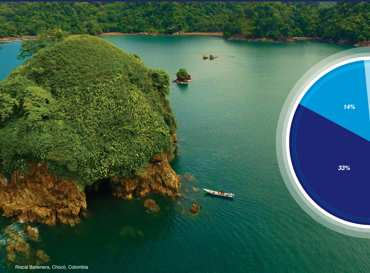
Riscal Ballenera, Chocó, Colombia

En alianza con nuestros donantes, durante el año 2018, Fundación MarViva invirtió en la región recursos equivalentes a US$2.760.000.