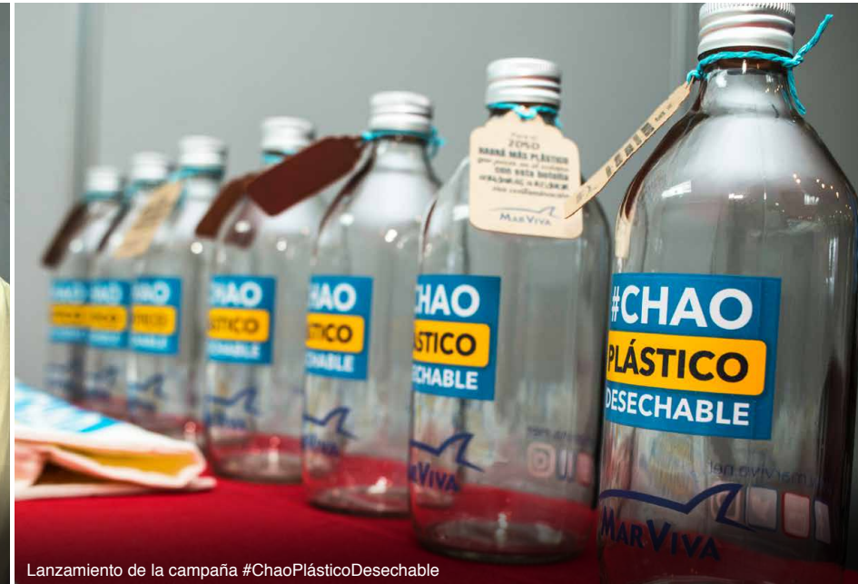
Lanzamiento de la campaña #ChaoPlásticoDesechable