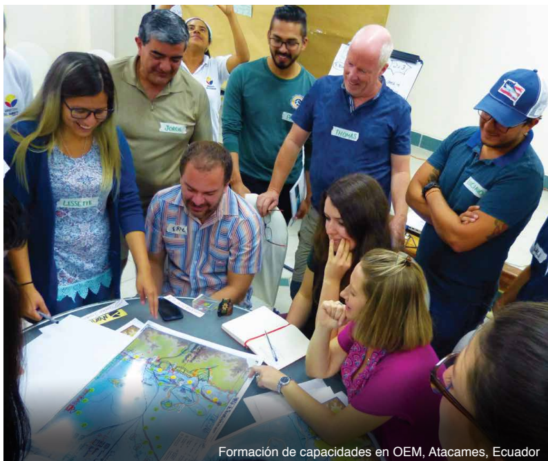
Formación de capacidades en OEM, Atacames, Ecuador