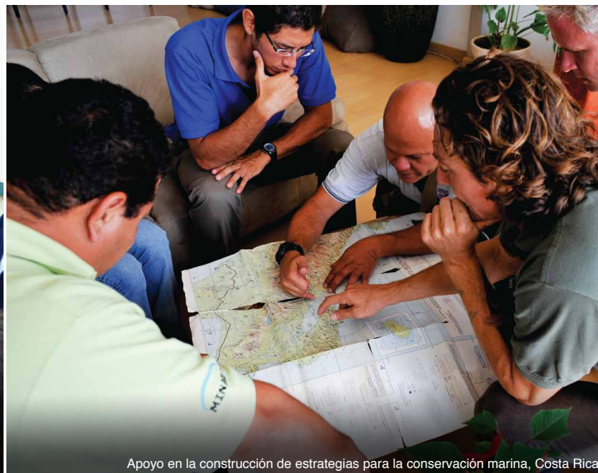
Apoyo en la construcción de estrategias para la conservación marina, Costa Rica

Los países costeros en el PTO enfrentan retos significativos que limitan su capacidad proactiva y reactiva en la protección y manejo del mar. Existen barreras técnicas, políticas, presupuestarias y estructurales que dificultan el flujo de información y la coordinación y colaboración a lo interno de las entidades estatales, así como entre instituciones complementarias de alcance nacional y regional.