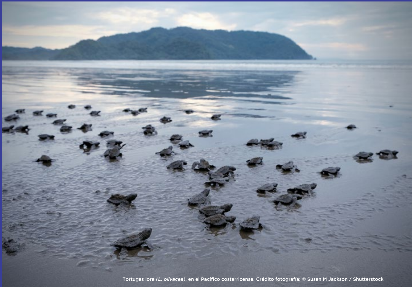
Tortugas lora ( L. olivacea ), en el Pacífico costarricense.

Únicamente se permite la reproducción parcial o total de esta obra, por cualquier medio, con autorización escrita de la Fundación MarViva. Dicho uso debe hacerse solo para fines educativos e investigativos, citando debidamente la fuente.