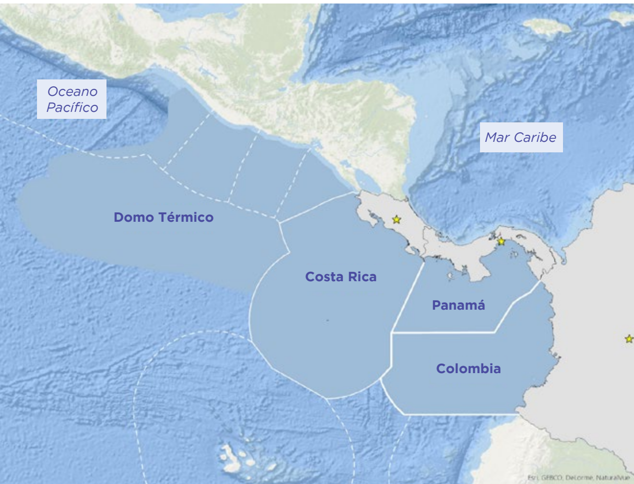
Figura 1. Región del Pacífico Tropical Oriental (PTO) donde se centra la atención primaria de la Fundación

La Fundación MarViva opera desde el 2002 promoviendo la conservación y el uso sostenible de los recursos y espacios marinos. Actualmente, MarViva posee oficinas en Costa Rica, Panamá y Colombia, con programas y proyectos de alcance local, nacional, regional y global. Tras más de 20 años de trayectoria, se ha posicionado como una organización líder en temas de conservación marina y desarrollo sostenible costero en el Pacífico Tropical Oriental (PTO) (Figura 1).