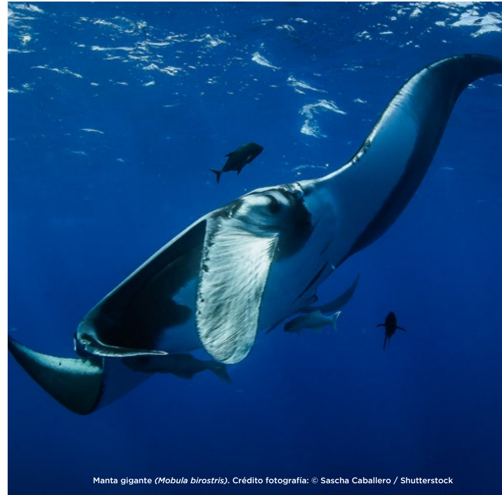
Manta gigante ( Mobula birostris ).