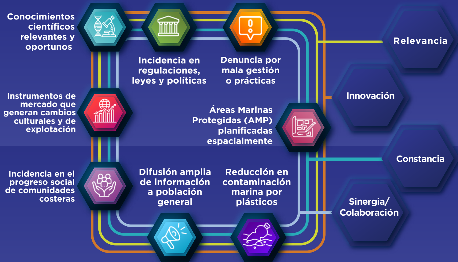
Figura 4. Productos y servicios de MarViva, transversales a los pilares estratégicos y a la cultura interna de la organización