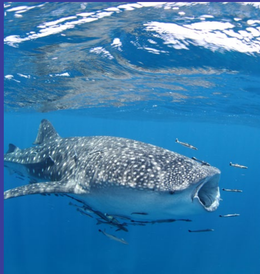
Tiburón ballena ( Rhincodon typus ).

Todos los derechos reservados Fundación MarViva 2024