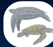
Tortugas baula y olivácea