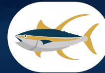
Atún aleta amarilla